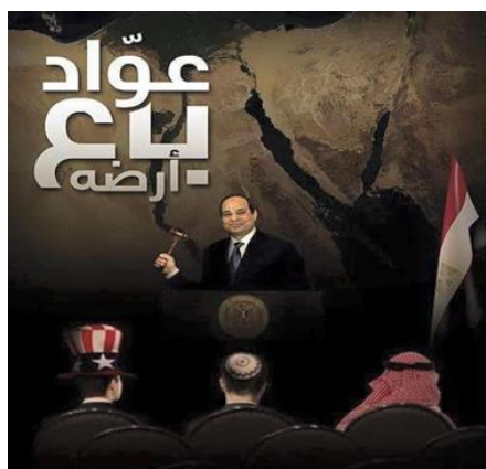
באנר שהופץ ברשתות החברתיות תחת הכיתוב "עואד מכר את אדמתו"

האיים טיראן וסנפיר השוכנים במפרץ עקבה נמצאו עד 1950 בידי סעודיה, והועברו באותה שנה למצרים בשל חשש להשתלטות ישראלית עליהם. מאז עלייתו של אל-סיסי לשלטון התחזקו היחסים בין מצרים לסעודיה על רקע התגברות האיום האיראני והטרור האסלאמי. במסגרת הידוק הקשרים בין המדינות וכהכרה על הסיוע הכלכלי הנרחב שסיפקה סעודיה למצרים, הסכימה האחרונה להיעתר לבקשת סעודיה להשיב לה את שני האיים.