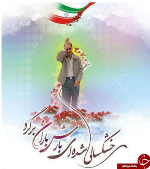
כרזת תמיכה באחמדינז'אד שהתפרסמה בערוצי "טלגרם" בראשית אפריל 2016

אחמדינז'אד, מצידו, הרחיב בחודשים האחרונים את פעילותו הציבורית, את הופעותיו הפומביות ואת נסיעותיו ברחבי המדינה. במהלך ראש השנה האיראני (נורוז) בחודש מרץ האחרון קיים סיור מתוקשר באתרי קרבות מלחמת איראן-עיראק בדרום-מערב המדינה, שנוצל על-ידו לפגישות עם אזרחים ולהטחת ביקורת כנגד מדיניות הנשיא רוחאני. 35 בד בבד, נצפתה בחודשים האחרונים פעילות הסברתית נרחבת של הנשיא ותומכיו במרחב המקוון. במסגרת זו הושק אתר אינטרנט רשמי מושקע ופעיל במיוחד, באמצעותו מועברים עדכונים שוטפים על פעילותיו והצהרותיו של אחמדינז'אד, מפורסמות תמונותיו, מסופקות סטטיסטיקות שנועדו להציג את הישגיו כנשיא, בעיקר בתחום הכלכלי, ונעשה בו שימוש כערוץ ליצירת קשר ולגיוס תומכים. 36 במקביל לפעילות האתר, מנהלים הנשיא לשעבר ותומכיו חשבונות בפייסבוק, באינסטגרם ובטוויטר. 37