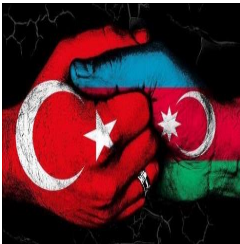
פוסטר שהופץ בטוויטר תחת התיג:

לאחר שהרשתות החברתיות בטורקיה סערו בחודשים האחרונים סביב מתקפות הטרור שהתרחשו באנקרה ובאיסטנבול, והאבדות הכבדות שספג הצבא הטורקי בקרבות בדרום-מזרח המדינה מול המחתרת הכורדית, כבש הסכסוך המזויין בין אזרבייג'ן לרפובליקה הארמנית נגורנו קרבאך (להלן: ראנ'ק) את השיח הציבורי. ככלל, התייצבו הגולשים הטורקים לצד אזרבייג'ן מתוך הזדהות לאומית ודתית עמוקה עם העם האזרי. עמדה זו זכתה לתמיכת הפוליטיקאים הטורקים, שראו בכך אמצעי לרכישת אהדת הציבור. ברקע לדברים עומדים, בין היתר, הסכסוך ארוך שנים בין הטורקים לארמנים סביב סוגיית השואה הארמנית, וחששם של הטורקים מאפשרות הופעתה של נוכחות צבאית רוסית על אדמת ארמניה השוכנת לגבולם המזרחי.