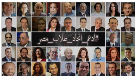
תמונות אישי ציבור מצריים התומכים במאבק התאחדות הסטודנטים המצרית