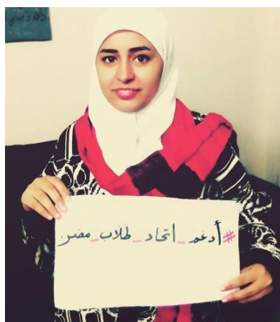
ראשת איחוד הסטודנטים לשעבר באוניברסיטת עין שמס ונשיאת ארגון "רושטה" לחינוך רפואי על בסיס התנדבותי, המביעה הזדהות עם מאבק התאחדות הסטודנטים במצרים