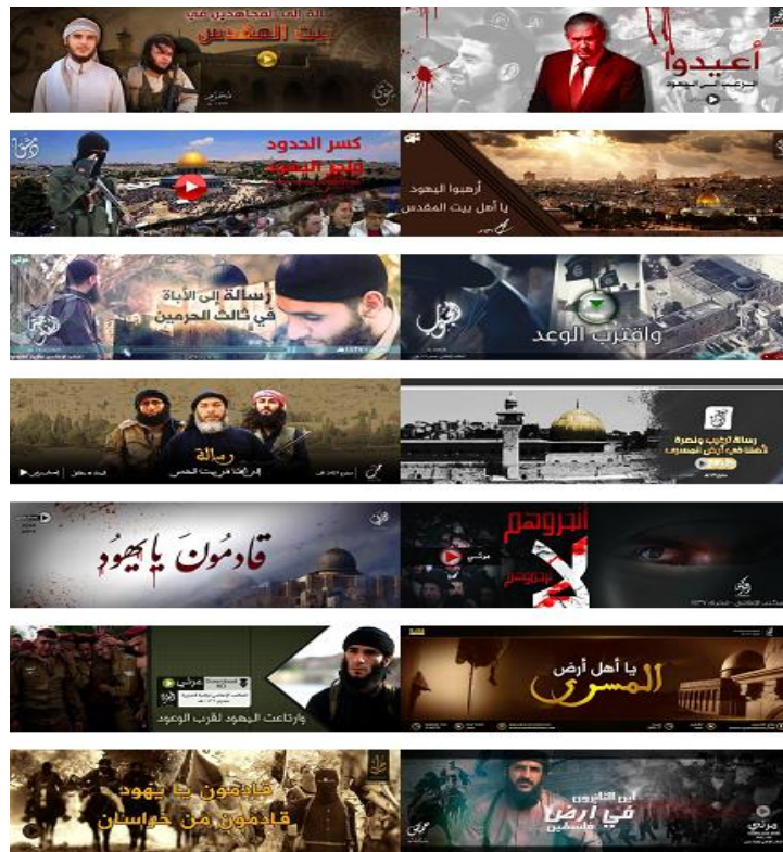
קמפיין "המדינה האסלאמית" נגד ישראל

הקמפיין נגד סעודיה, תומכי הארגון פרסמו פוסטים הקוראים להפיץ את הסרטונים תחת ההאשטג #بلاد_الوحي_صيرا (הוי ארץ ההתגלות, התאזרי בסבלנות), שהפך לאחר מכן לסיסמת הקמפיין. 13 בקמפיין נגד ישראל ההאשטג המוביל שאיתו הופצו הסרטונים היה #نحر_اليهود (שחיתת היהודים) ובקמפיין שהופנה לא-שבאב נבחר ההאשטג #أبها_المجاهد_في_الصومال (הוי לוחם הג'יהאד בסומליה).