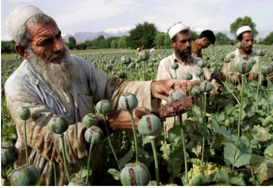
איסוף אופיום באפגניסטן :

http://www.cbsnews.com/news/afghanistan-taliban-double-opium-income-new-strain-high-yield-poppy-seed/