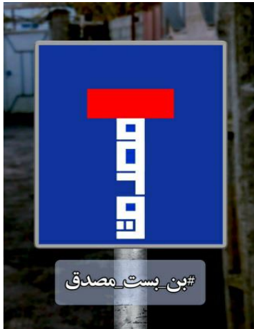
"מבוי סתום מוסאדק"

התנגדויות להצעה נשמעו מצד גולשים המזוהים עם הימין השמרני, שהפיצו את תגובותיהם תחת התיאור: "מבוי סתום מוסאדק" ("#بين_بست_مصدق"). לטענתם, הצעת מועצת עיריית טהראן מנוגדת לעמדת מכון המהפכה האסלאמית, איתאללה ח'ומייני, וכל תכליתה לחפות על כישלונות עיריית טהראן. מספר גולשים טענו כי עדיף היה אילו במקום להתעסק בהסבת שמות רחובות, היתה מועצת העיר מקדישה את מאמציה לפתרון מצוקותיהם הקשות של אזרחי העיר. "בעקבות שינוי שם רחוב הפועל למוסאדק על-ידי מועצת העיר, בעיית זיהום האוויר והתחבורה בטהראן נפתרה", צייצה בלעג אחת הגולשות. 17