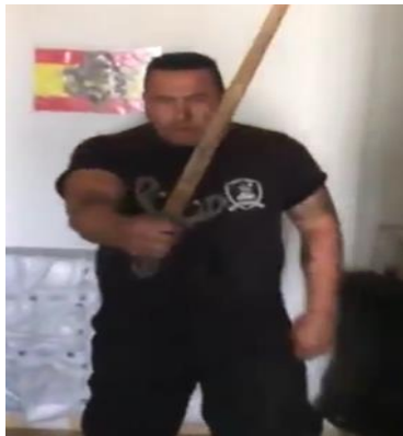
התצלום נלקח מתוך הסרטון שהופץ בחשבון הטוויטר של "Soy de Derechas", ובו מוצג אדם המאיים לדקור מוסלמים

פיגוע הדריסה בשדרות לאס-רמבלס בברצלונה שאירע ב-17 באוגוסט נחשב לאירוע הטרור הראשון שבוצע בידי ג'יהאדיסטים על אדמת ספרד מאז הפיגועים שבוצעו במדריד במארכס 2004. ככל שידוע לעת כתיבת שורות אלו, בוצע הפיגוע בידי אזרחים ספרדים שהזדהו עם ארגון דאע"ש שמצדו נטל על כך אחריות. השיח הרשתי שהתפתח בעקבות הפיגוע היה מגוון וכלל הומור שחור ולעג כלפי הג'יהאדיסטים, לצד שיח אלים ומסית שקיבל, בין היתר, ביטוי באלימות פיזית שהופנתה כלפי מוסלמים במדינה. השיח הרשתי חושף את תפיסת האיום בה מחזיקים גולשים מהימין הקיצוני בספרד, שמקורה בתקופת ימי הביניים עם כיבוש חצי האי האיברי בידי המוסלמים, המתכתב למרבה האבסורד עם עולם התוכן שמציגים מהצד השני של המתרס הגולשים הג'יהאדיסטים, במטרה להצדיק את פעילותיהם האלימות נגד האוכלוסייה הלא מוסלמית באירופה, ובספרד בפרט. 17