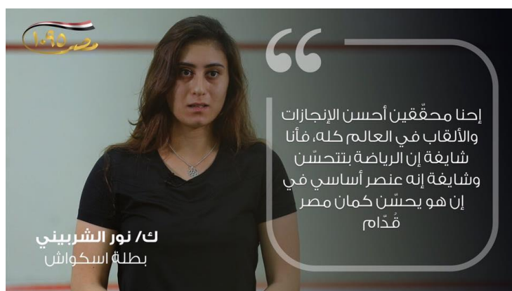
נור אל-שריביני, אלופת הסקווש של מצרים, מציינת לשבח את התנופה בהישגי ענף הספורט במהלך כהונתו של אל-סיסי, במסגרת הקמפיין הרשתי "מצרים 1095"

על רקע ההיערכות לבחירות לנשיאות מצרים האמורות להתקיים באפריל 2018, מתנהל בחודשים האחרונים שיח קדחתני ברשתות החברתיות הבוחן את הישגי המשטר תחת נשיאותו של עבד אל-פתאח אל-סיסי ודן בשאלה האם יש לבחור בו לכהונה נוספת. אזרחים מצרים רבים מוקירים תודה לאל-סיסי על היחלצותו להגנת המולדת המצרית מפני ניסיון האחים המוסלמים להשתלט על מוסדות המדינה בתקופת נשיאותו של מורסי ומפני הטרור של דאע"ש. יחד עם זאת, ניכרת תחושת אכזבה בשל מה שנתפס כאי הצלחתו לשפר את רווחת התושבים, בדגש על התחום הכלכלי. בעוד שתומכי אל-סיסי מבקשים למקד מאמץ בקידום הכלכלה המצרית, קוראים האחים המוסלמים לאל-סיסי להתפטר לאלתר. ברקע, מעודדים פעילי שמאל להחרים את הבחירות או לחילופין, להצביע למועמדים אחרים, גם אם סיכוייהם אפסיים, וזאת כאות מחאה כנגד מדיניותו של אל-סיסי. השיח הרשתי מצביע, אפוא, על האמביוולנטיות שחשים גולשים מצרים כלפי אל-סיסי.