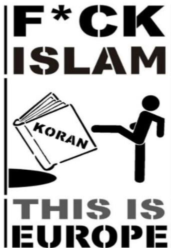
האיור נלקח מחשבון הטוויטר " Kfan Patria & Madrid תחת הכיתוב " F*CK ISLAM – THIS IS " EUROPE