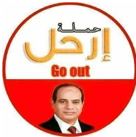
באנו של האחים המוסלמים הקורא לאל-סיסי להתפטר מהנשיאות

ביקורות אחרות, שהועלו בעיקר מצד סטודנטים מצרים אנטי-אסלאמיסטים ללא שיוך מפלגתי, עסקו בדיכוי חופש הפרט. השיח בנושא התחדש בעקבות החלטת שר החינוך המצרי באמצע ספטמבר לחייב את תלמידי האוניברסיטאות לשיר את המנון המדינה מול דגל מצרים במטרה לחזק את הקשר למולדת. סטודנטים רבים התייחסו להחלטה כבדיחה השמה אותם ללעג והדגישו כי ישנן דרכים אחרות לחיזוק רגשות הלאום. לדבריהם, מוטב היה אם המשטר היה מאפשר לקיים בקמפוסים בחירות לאגודות הסטודנטים ללא התערבות חיצונית, תוך מתן חופש ביטוי ושחרור סטודנטים מהכלא, שהורשעו רק משום שהעזו לבקר את המשטר. 43