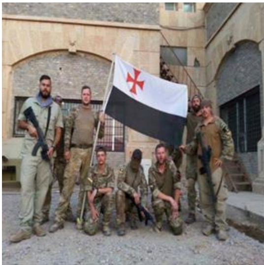
התמונה הופיעה בעמוד הפייסבוק של תנועת "בריטניה תחילה" בצירוף הכיתוב "מתנדבים אנטי-דאע"ש אמיצים מניפים את הדגל הטמפלרי בסוריה!"

עם השתלטות דאע"ש על שטחים נרחבים בעיראק וסוריה, החל הארגון ברדיפה אחר נוצרים וקהילות מיעוט נוספות שהביאה להתגייסותם של מתנדבים מארצות נוצריות שונות, בעיקר מצפון אמריקה ומאירופה, להגנתם. מספר המתנדבים, שגויסו ברובם באמצעות הרשתות החברתיות, מוערך במאות בודדות. 1 כחלק ממאמץ זה נוצר גם שיח נוצרי נגדי לשיח הרשתי המפותח של דאע"ש, שמשקף אידיאולוגיה אנטי-אסלאמית המזוהה עם הימין החדש במערב, וחולק למרבה האירוניה קווי דמיון לא-מעטים עם השיח הדאע"שי. 2 הזנת המתנדבים בתכנים מסוג זה עלולה לקבל ביטוי בפעולות אלימות שיופנו נגד מוסלמים במדינות המוצא, לכשישובו המתנדבים למדינותיהם עם הידע והניסיון הצבאי שרכשו במהלך הלחימה בשטחי עיראק וסוריה. למעשה, ניתן להיווכח כבר כיום בפעילות בולטת של גורמים אנטי-אסלאמיים שכאלה במדינות המערב.