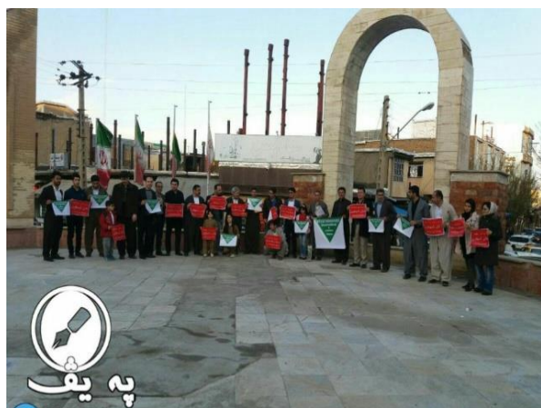
הפגנת סולידריות עם קורבנות המתקפה הכימית בסוריה, בהשתתפות משפחות קורבנות המתקפה הכימית העיראקית שבוצעה ביוני 1987

תקיפת בסיס חיל האוויר הסורי בעיר חומס שבמערב סוריה על-ידי צבא ארה"ב בלילה שבין ה-6 ל-7 באפריל עוררה תגובות מעורבות ברשתות החברתיות באיראן, המשקפות את עמדתו המורכבת של הציבור כלפי המשבר הנמשך בסוריה. מחד גיסא, גולשים הצדיקו את התקיפה שהתרחשה על רקע מתקפת הגז במחוז אידליב שיוחסה למשטר אסד, ואשר הביאה למותם של למעלה ממאה אזרחים, בהם ילדים רבים. מאידך גיסא, טענו גולשים אחרים כי הפעולה האמריקאית חושפת את צביעות המערב ביחס להתרחשויות במזרח התיכון, והטילו ספק ביעילותה.