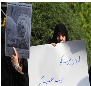
"גבר, היכן הכבוד שלך? איפה הרעלה של אשתך?", מפגינה בכיכר פאטמי

במקביל פתחה התקשורת השמרנית במתקפה אישית חריפה נגד עלינז'אד, שהואשמה בשיתוף פעולה עם המערב לשם פגיעה ברפובליקה האסלאמית ובערכי המהפכה. בין היתר פרסמה הטלוויזיה האיראנית דיווח