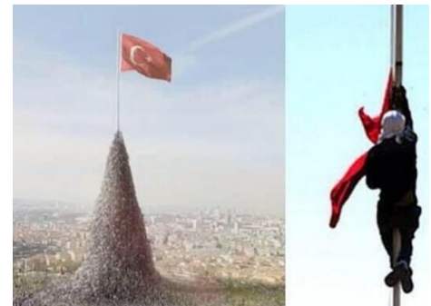
מימין: מפגין כורדי מוריד את הדגל הטורקי. משמאל: העם לא נותן לדגל טורקיה ליפול על הקרקע בסרטון התעמולה של ה-AKP

ברם, גם ביטויי האחוה נעלמו כלעומת שבאו, לאחר שפעילים כורדים חדרו לבסיס צבאי והורידו את הדגל הטורקי מן התורן. ההתרסה העלתה את חמתם של טורקים רבים ובהם גם אנשי גזי פארק. התגובות ברשתות החברתיות היו סוערות והיו אף שהביעו שביעות רצון מהריגת המפגינים הכורדים תחת סיסמא "בליגיה מתבצע ניקיון." 4 במקביל, התארגנו גולשים בכל רחבי טורקיה ויצאו עם הדגל הטורקי לרחובות תחת הסיסמא "הדגל הוא כבוד העם." 5 חשוב לציין כי במסגרת זו נשמעה גם ביקורת קשה כלפי ארדואן: גולשים המתנגדים לתהליך השלום עם הכורדים טענו כי מדיניותו המתפשרת הובילה לפגיעה בסמל הריבונות הטורקית. הם הזכירו