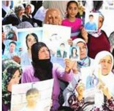
אימהות מפגינות עם תמונות ילדיהן

תהליך השלום המתקדם הוביל לשינוי בשיח הציבורי, שהפך לפתוח יותר מאשר בעבר. עדות לכך היא מחאת הנוכחית של אימהות כורדיות מן העיר דיארבאקיר, אשר לפני כחודש ימים הוברחו ילדיהן להרים לשם