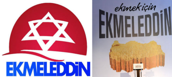
מימין סמלו המקורי של איחסאנאולו. משמאל הסמל שעוצב על ידי תומכי ארדואן.

הבחירות הנוכחי לנשיאות השתמש ארדואן כהרגלו בעמדתו הנוקשה כלפי ישראל כדי לנגח את יריביו ותקף, לדוגמה, את איחסאנאולו על הצהרתו כי טורקיה צריכה לשמור על עמדה ניטרלית במזרח התיכון וליטול את תפקיד המתווך ההוגן.