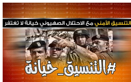
"התיאום הביטחוני – בגידה"