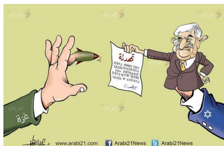
"תגובת" חמאס להצעת הפסקת האש

הלאומית לשבירת המצור על עזה' צייץ, כי "תושבי הגדה מוזמנים לצאת במהפכה של כעס בפני הכובש". 4 עם תחילתו של מבצע "צוק איתן" ועל רקע התקיפות האוויריות של צה"ל, תבעו גולשים, בעיקר מקרב חמאס, להפסיק לאלתר את התיאום הביטחוני בין הרשות הפלסטינית לבין ישראל (בתמונה) ולבטל את