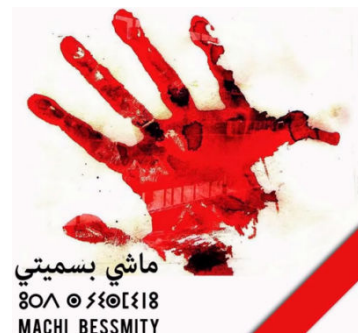
הבאנו שהפיקו פעילים מרוקאים בשלוש שפות – "לא בשמי"

גם במרוקו השיקה קבוצת פוליטיקאים, אנשי תקשורת, אנשי רוח ופעילים צעירים קמפיין דומה ברשתות החברתיות, בשפות ערבית, אמזיגית (שפת המיעוט הברברי) וצרפתית. מטרתו המוצהרת של הקמפיין היא מיגור "הפעולות הברבריות, המבוצעות על ידי קנאים צמאי דם, שכלל אין ליחסן לאסלאם", וכמה ממשותפיו העלו סרטוני מחאה והוסיפו לחשבונותיהם את לוגו המערכה: כף יד פרושה מרוחה בדם ועליה הכתובית "לא בשמי". צעיר מרוקאי אחד ציין כי הטרוריסטים ממיטים חרפה על המוסלמים, וכי חשוב להשמיע את קול המרוקאים נגד