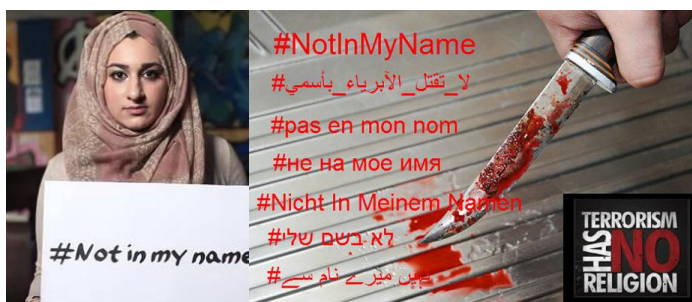
מימין לשמאל: מוסלמית בריטית בתשדיר נגד דאע"ש; באנר שהעלה פעיל מוסלמי בריטי לרשתות החברתיות

בראשית ספטמבר 2014 השיקו פעילים מוסלמים מבריטניה, חברי עמותה אזרחית בשם Active Change Foundation, קמפיין הסברה מקוון בגנות דאע"ש בשפה האנגלית תחת הכותר "לא בשמי". הגורם הישיר ליוזמה היה רצח עובד הסיוע ההומניטארי הבריטי דיוויד היינס בידי פעילי דאע"ש. במסגרת הקמפיין פורסם סרטון הסברה המבהיר מדוע ארגון דאע"ש איננו מייצג את המוסלמים ומהווה ניגוד גמור לאסלאם. גולשים רבים טענו כי הארגון איננו מכבד ערכים אנושיים כמו חמלה, פוגע בחייהם של אנשים חפים מפשע ומנכס לעצמו את דת האסלאם כדי לשטוף את מוחותיהם של צעירים מוסלמים. פעילי העמותה קראו למוסלמים ברחבי העולם לאחד שורות כדי לשים קץ לפעילות הארגון ולרדיקליזציה שהוא מייצג, ובה בעת העירו כי ההיסטוריה מלאה בדוגמאות של מעשי אלימות מצד קבוצות שונות: כשם שאין להסיק מהנאצים שהנצרות טבועה באלימות, כך אין להשליך מדפוסיו של דאע"ש על טבעו של האסלאם. 4