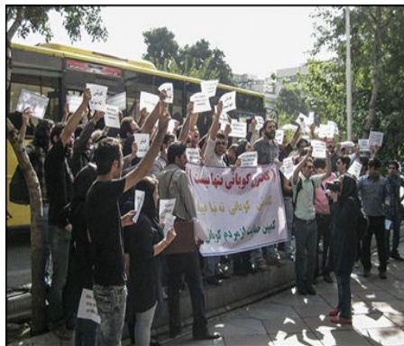
הפגנה מול שגרירות טורקיה בטהראן

השיח ברשתות חושף גם את עמדתם המורכבת של אזרחי איראן לנוכח התחזקות דאע"ש. בעוד שברשת עולים קולות התובעים ממדינות המערב להתגייס ולהתערב צבאית למען הכורדים,