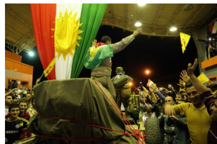
אזרחים טורקים ממוצא כורדי מקבלים את פניהם של לוחמי ה"פשמרגה" בגבול טורקיה-עיראק

גולשים טורקים רבים הטילו ספק במניעי חברות NATO שלחצו על פתיחת המעבר. בין היתר נטען, כי מדובר בניסיון של אלו לפגוע באינטרסים החיוניים של טורקיה. הלוך רוחות זה השתקף, בין היתר, בסקר שנערך מטעם מכון המחקר האמריקאי PEW שקבע כי 70% מקרב