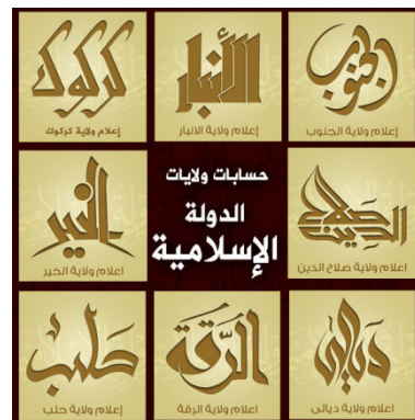
רשימת חשבונות טוויטר של מחוזות דאע"ש המדווחים על פעילותו

הרשתות החברתיות מהוות נדבך מרכזי במערך ההסברה והגיוס של דאע"ש, העושה בהם שימוש מושכל להפצת מסריו אל קהלי יעד רבים, וככלי לאינדוקטרינציה וללוחמה פסיכולוגית. כך לדוגמה, ניתן למצוא פעילים רבים מקרב הארגון מנהלים שורה של חשבונות טוויטר אישיים בשפות שונות, בהם הם מתעדים את חוויותיהם בלחימה, מסבירים את פעילות הארגון, מדברים בזכות מילוי מצוות הג'האד ומעודדים מוסלמים נוספים לקחת חלק בפעילות דאע"ש. הארגון חולש, למעשה, על מערך מובנה ומסועף של מוסדות תקשורת האמונים על הזרמת מידע שוטף באשר לפעילותו