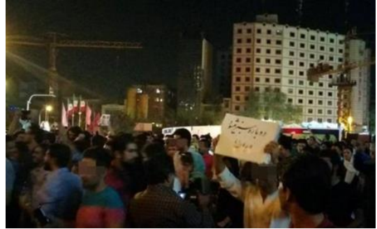
חוגגים בטהראן מניפים שלט: "איראן תהיה שוב ירוקה"

הימין הרדיקלי באיראן, שכנותיה הערביות וישראל, לעומת זאת, זכו לקיתונות של ביקורת והוצגו כמפסידים הגדולים של הסכם הגרעין. ראש ממשלת ישראל, בנימין נתניהו, זכה לתגובות עוינות במיוחד בעקבות הביקורת החריפה שהשמיע כנגד ההסכם. התגובות כללו נאצות, השמצות ואיחולים למותו. 5 לצד גילויי השמחה והציפיה לשיפור המצב הכלכלי הביעו גולשים רבים תקווה כי הסכם הגרעין יוביל לשיפור גם במצב זכויות האדם באיראן. התגובות להסכם כללו, בין היתר, קריאות לנשיא רוחאני לממש את הבטחת הבחירות