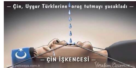
סין אסרה על הטורקים האויגורים לצום - עיני סיני -

במסגרת המחאה הרשתית בעניין האויגורים העלו הגולשים תמונות בהן נראה דגל מזרח טורקיסטאן (המעוצב כמו הדגל הטורקי אך צבעו כחול), ההולך ומוצף ב"דם" המדומה לדגלה האדום של סין. כן הופצו גם קריאות ליציאה להפגנות בטורקיה וברחבי אירופה. 22 תופעה מעניינת באה לידי ביטוי בעובדה שפעילים פרו-אויגורים השתמשו בהאשטאגים המוכרים מהסכסוך הישראלי-פלסטיני (בתמונה הימנית). 23 שימוש זה משקף את שליטת הגולשים בטכניקות להפצת מידע במדיה החברתית, שכן הוא מאפשר את הרחבת מעגלי החשיפה למאבק האויגורים