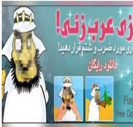
משחק רשת הקורא להכות בערבים

תרבותית. דוגמה טובה לכך היא תגובתם הזועמת של גולשים איראניים לסרטון שהופץ בנובמבר 2010 ברשת היוטיוב ותיעד קטעים מנאומו של מזכ"ל חזבאללה, חסן נצראללה, שהתייחס לזהותה המוסלמית של איראן