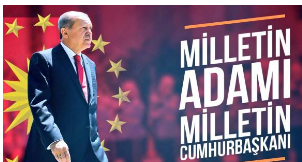
כרזה שהפיצו תומכי ארדואן בטוויטר, עם

מאז ניסיון ההפיכה הכושל שארע ב-15 ביולי 2016, חווה טורקיה שינויים דרמטיים במערכת הפוליטית. ההכרזה על מצב חירום מיד לאחר ניסיון ההפיכה ומשאל העם שנערך באפריל אשתקד והעניק לנשיא טורקיה רג’פ טאיפ ארדואן סמכויות נרחבות מבלי שהוחלה מערכת איזונים ובלמים מספקת, הפכו את הבחירות לנשיאות המדינה ב-24 ביוני לגורליות. בתום מערכה בחירות שבה נהנה הנשיא הטורקי משיתוף פעולה מלא עם התקשורת, הוא זכה ב-52.3% מהקולות והביס את יריביו כבר בסיבוב הראשון. זמן קצר לאחר מכן, הוחלו מספר צווים נשיאותיים שנויים במחלוקת בעלי השפעה על מרקם החיים במדינה בתחומים כתרבות, משפט, והשכלה גבוהה.